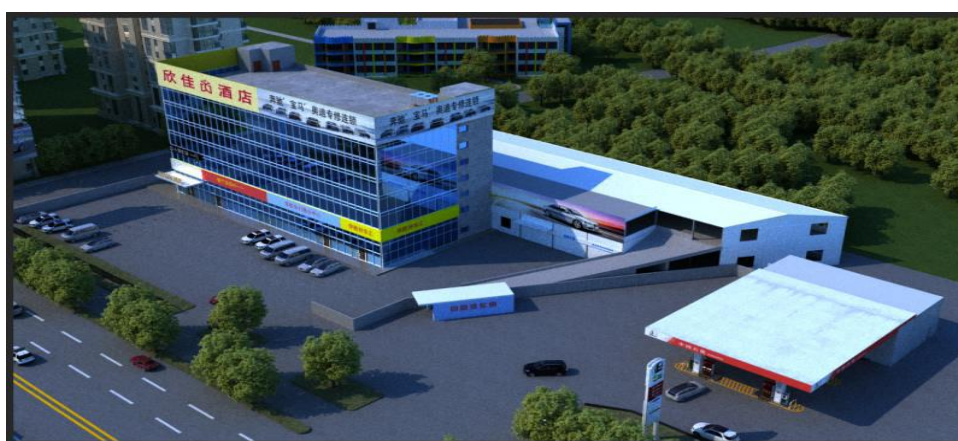
图 3 事故发生时建筑物及周边环境情况还原图

2019 年 9 月，欣佳酒店建筑物一层原来用于超市经营的两间门店停业，准备装修改做餐饮经营。2020 年 1 月 10 日