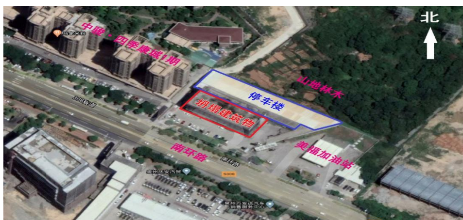
图 2 建筑物卫星定位图

筑物各层具体功能布局为：建筑物一层自西向东依次为酒店大堂、正在装修改造的餐饮店（原为沈增华便利店）、华宝汽车展厅和好车汇汽车门店；二层（原北侧夹层部分）为华宝汽车销售公司办公室；三层西侧为小灰餐饮店（欣佳酒店餐厅），东侧为琴悦足浴中心；四层、五层、六层为欣佳酒店客房，每层 22 间，共 66 间；七层为欣佳酒店和华胜车行员工宿舍；建筑物屋顶上另建有约 40 平方米的业主自用办公室、电梯井房、4 个塑料水箱、1 个不锈钢消防水箱。