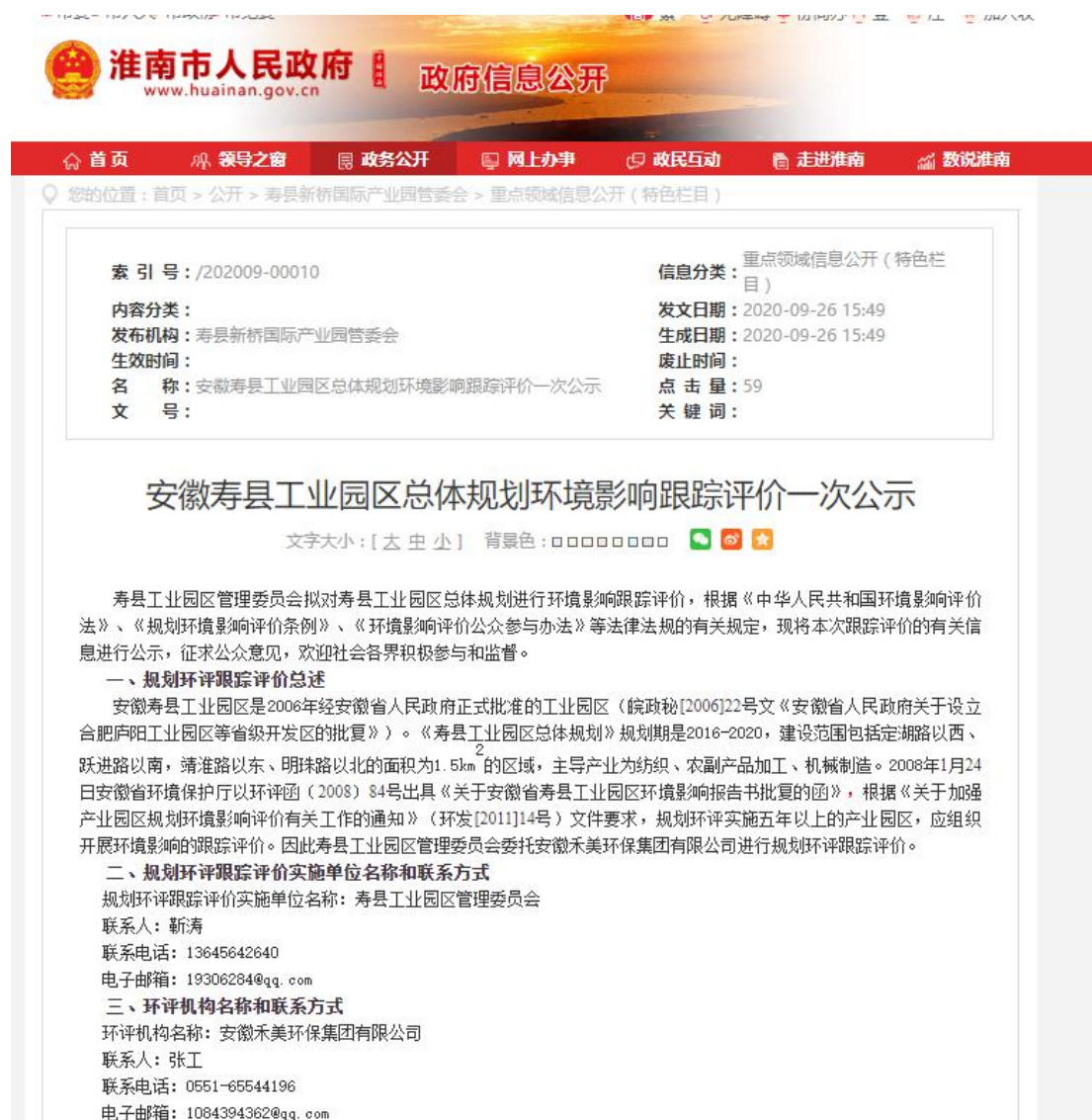
图1 本项目首次公示网络截图