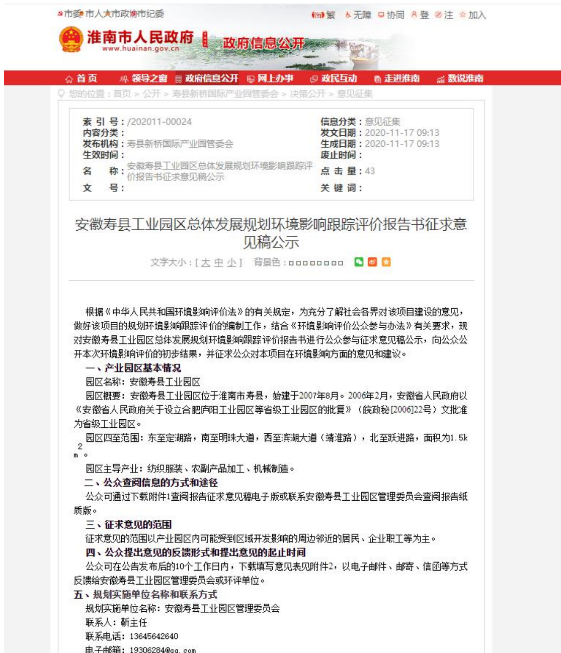
图 2 本项目征求意见稿公示截图