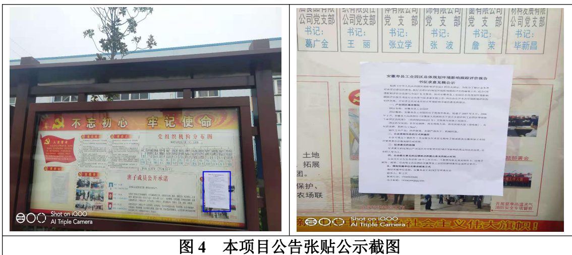
图 4 本项目公告张贴公示截图

本次公众参与征求意见稿公示期间，同时在园区管委会的信息公告栏张贴了公众意见征询公告。图片如下：