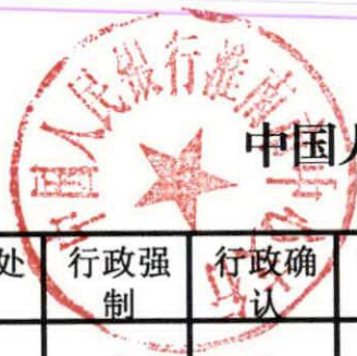
中国人民银行淮南市中心支行调整后清单数量统计表